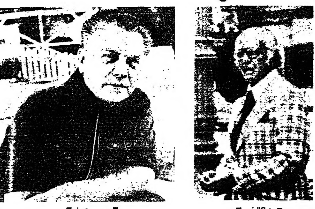
■ جيكالوني ■

وكانت القوى التي تناصر هونا يتوجهوا رئيس نزع الاتحاد بديروت ديفيس جونسون ، ويقود قوى المعارضة نجس نيترسيونز ديفي . وقد حدث اخيرا بينما كان فرانك نيترسيونز يقضي كلسا في احد شارب ترويت ، ان نصف اعضاء سيارته «النيونكون كورنتال» بموديل ١٩٧٥ ، الواقعة امام الشرب ، وكانت السيارة ملكا للاتحاد ، وتمسرح جونسون لضرب وحطت نورايد كتيبه بطاقت بنديقه سيد ، وجر بخنقه بافتجار فليش .